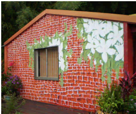
手工藝品教室~外觀就美美的唷！

我比較感興趣的事是手工藝品那一個地點，小小的一堅守工藝品教室，擺滿了各式各樣的手工藝品：