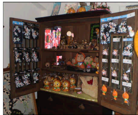
這個櫃子擺了很多小東西！