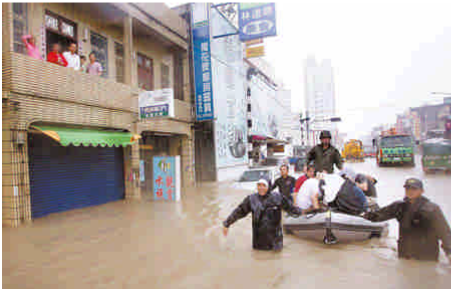
《 淹水的大概類似程度 》

不但水面飄浮著大量的木頭及垃圾，水底下也充斥著大量的泥沙、石頭等等，走起路來非常的艱難，而且也很害怕腳底會踩到什麼危險的東西，例如：玻璃或尖銳的石頭、物品等等，由於也是屬於較鄉下的地方，田園及草木的地區也比較多了些，因此更不用提會害怕水中可能潛伏著水蛇等等的危險生物。